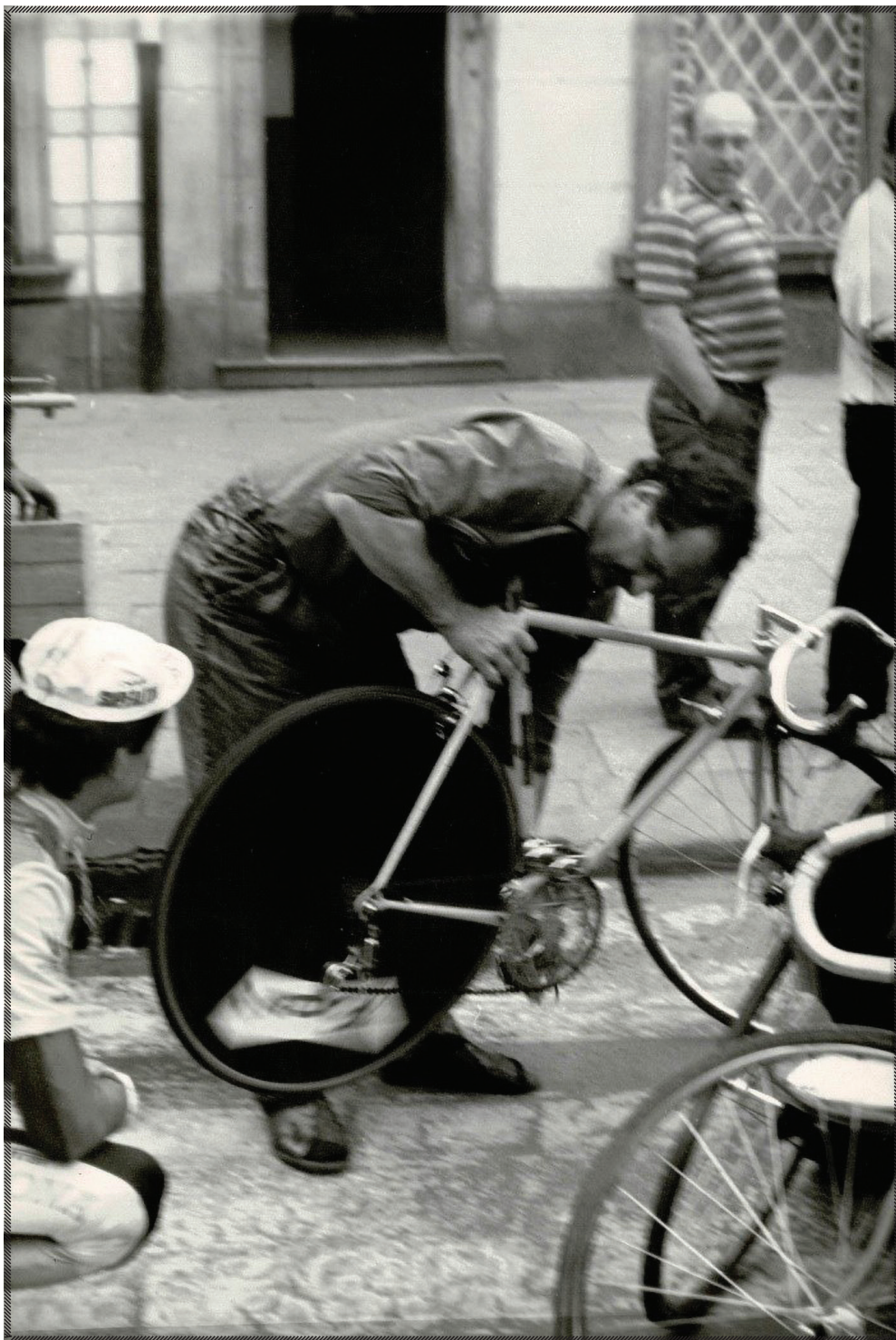
Fot.2 Sprawdzanie sprzętu przed startem, Mistrzostwa Polski w indywidualnej jeździe na czas, 28.09.1990 r. Nysa